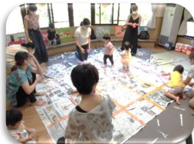
うさぎちゃん Day 「新聞紙遊び♡」