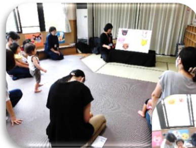
どんぐりころころさんの 「おはなし会♪」